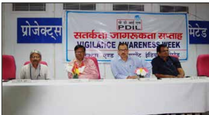
Vigilance Awareness Week celebration at PDIL Noida

सतर्कता आयोग और एसपी, सीबीआई, स्थानीय शाखाओं के नाम, पते और फोन नंबर दिए गए हैं, जिनसे भ्रष्टाचार की शिकायत की जा सकती है।