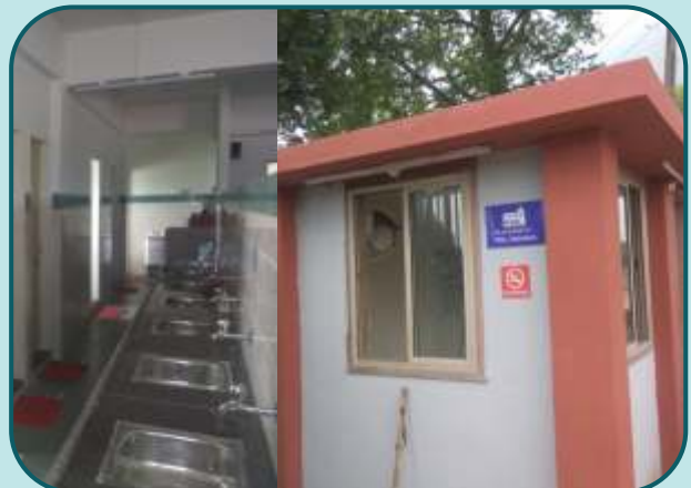
Construction of 7 Washrooms & one Security Cabin funded by PDIL for underprivileged children near Vadodara