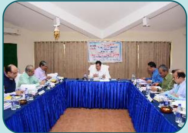
A view of 253rd Board Meeting at Hotel Toshali Sands, Puri.