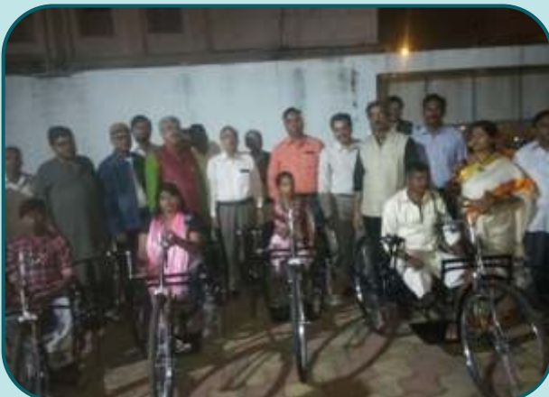
Distribution of free tricycles to physically challenged persons at Vadodara.