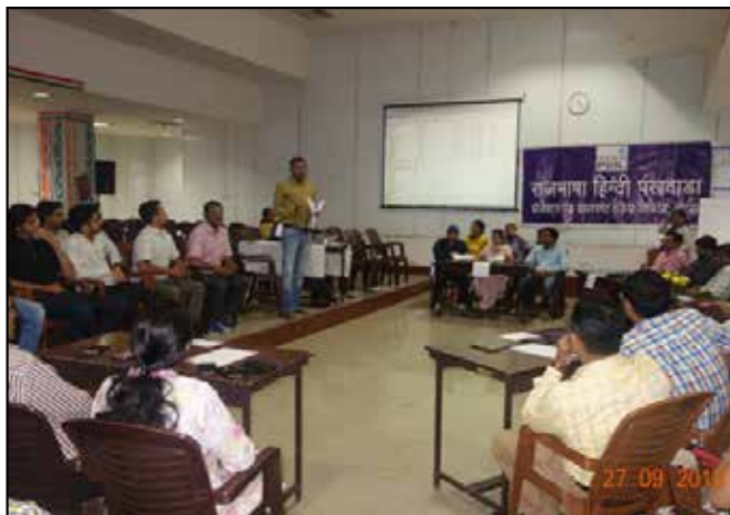
Rajbhasha Hindi Pakhwada at PDIL, Noida

की गई। हमारे वड़ोदरा कार्यालय को हिंदी में उत्कृष्ट कार्य के लिए नगर राजभाषा कार्यान्वयन समिति द्वारा प्रथम पुरस्कार प्रदान किया गया। पीडीआईएल के कर्मचारियों ने नगर राजभाषा कार्यान्वयन समिति द्वारा आयोजित विभिन्न प्रतियोगिताओं में पुरस्कार जीते हैं। 31.12.2018 को समाप्त तिमाही के लिए पीडीआईएल में राजभाषा नीति के कार्यान्वयन की तिमाही प्रगति रिपोर्ट का विश्लेषण करने के बाद, उर्वरक विभाग ने कंपनी द्वारा की गई प्रगति की सराहना की है।