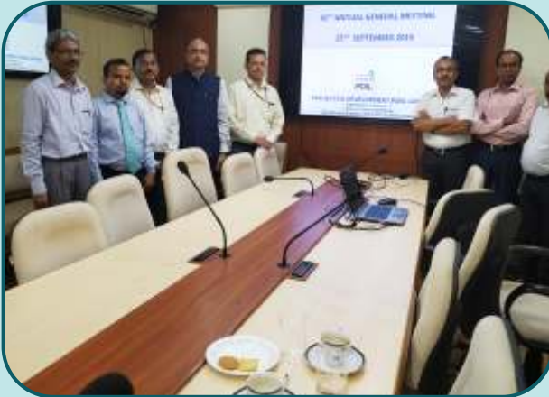
A view of 41st AGM of PDIL at Conference Room, 2nd