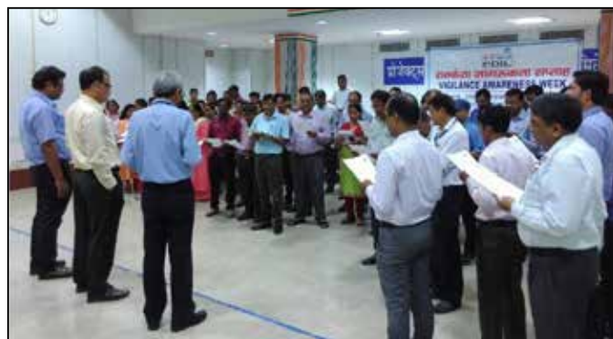
Vigilance Awareness Week celebration at PDIL Noida

आपकी कंपनी, बेहतर जन संपर्क बनाए रखने के महत्व को समझती है। पीडीआईएल ने फर्टिलाइजर एसोसिएशन ऑफ इंडिया (एफ.ए.आई.), इंटरनेशनल फर्टिलाइजर एसोसिएशन (आई.एफ.ए.), स्कॉप, प्रोसेस लाइसेंसर्स जैसे एच.टी.ए.एस., के.बी.आर. इत्यादि की सेमिनार/सम्मेलनों में भागीदारी की