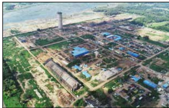
Aerial View of HURL Gorakhpur