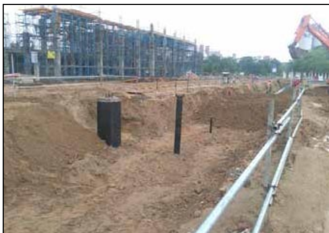
UG Pipe Laying Urea Plant Area: HURL Sindri

PDIL has firmly established its credentials as a Third Party Inspection (TPI) and Non-Destructive Testing (NDT) Agency. Statutory inspection, testing and certification of LPG / Ammonia Horton Spheres, Mounded LPG Bullets, Inspection & Re-commissioning of Ammonia Storage Tanks and Health Assessment of Reformer Tubes by Automatic Ultrasonic Scanning (AUS) continued to be the specialized activities of PDIL.