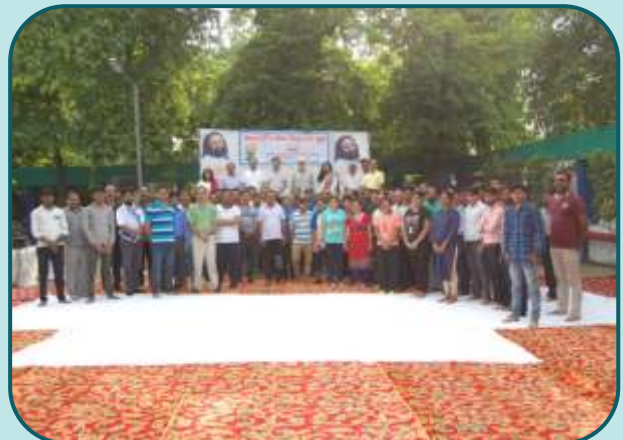
Yoga Day Celebration at PDIL, Noida.