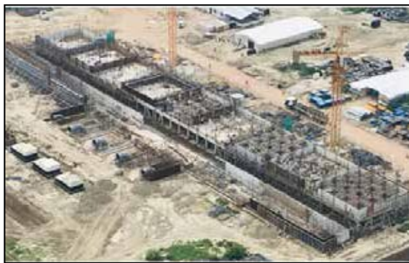
Ammonia Cooling Tower (Under Construction): HURL Barauni