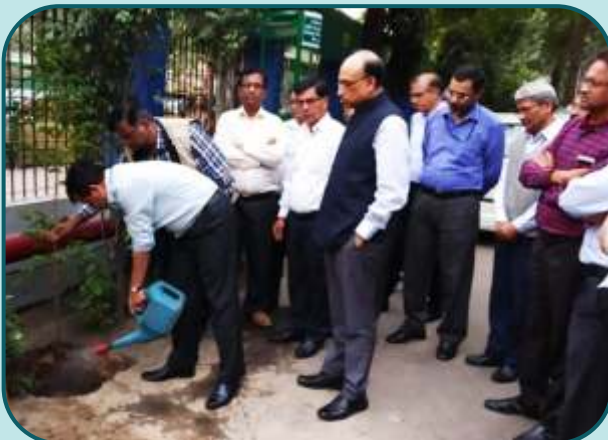
Tree Plantation Programme at PDIL, Noida.